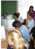
leškan tieji darbo teikė šimtus klausimų.

galimybių lavintis ir didinti patrauklumą darbdaviams: šie dalyviai galės klausytis nuotolinių kursų, kuriuos dovanoja tarptautinė nuotolinio mokymo bendrovė „International Correspondence Course“ ir tarptautinė e-programų ir savarankiško mokymosi kursų kompanija „LearnKey“.