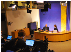
Patarimai internetu sklido iš modernios studijos.