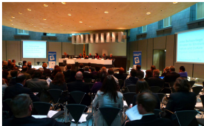
Kongrese „Technologijos ir dar daugiau viešosiose bibliotekose“ dalyvavo ir Lietuvos delegacija.

Dvi dienas klaušę pranešimų ir diskutavę įvairiose darbo grupėse, kongreso dalyviai priėjo išvadas, kad e-įterpties skatinimas yra viena pagrindinių šiuolaikinės bibliotekos misijos ašių. Viešosios bibliotekos turi siekti pritraukti visus gyventojus, nepriklausomai nuo jų socialinės padėties, ir jiems teikti kokybišką informaciją. Bibliotekų siūloma „papildoma vertė“ – neformali, bendrauti ir dalintis skatinanti er-