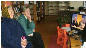
Senjorus domino interneto galimybės.

Lapkričio 10 d. ypatingai laukiami svečiai bibliotekose buvo vyresniojo amžiaus lankytojai: tądien startavo jiems skirta akcija „Esenjoras.lt“.