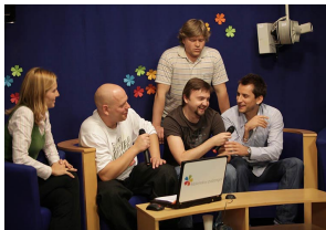
Atlikėjai noriai įsitraukė | akciją.

kūrėjai buvo kviečiami ne tik rašyti dainas, bet ir lankyti bibliotekose vykusiame popietėse ir internetu bendrauti tarpusavyje, tartis su psichologais, dalintis mintimis su akcijoje dalyvaujančiais atlikėjais. Jų – visas žvaigždynas: Saulius Urbonavičius – Samas, Gabriėlius Liaudanskas – Svaras, Marijonas Mikutavičius, Stanislovas Stavickis – Stano, Alanas Chošnau, grupės „Biplan“ ir „Saulės kliošas“. Jau visai netrukus atlikėjai atrinks geriausius jiems dedikuotus dainų tekstus ir pavers juos tikromis dainomis – sukurs vaikų parašytiems žodžiams muziką ir kūrinius įrašys studijoje. Visą lapkritį kviečiame