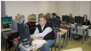
Artimiausiu metu dar 165 bibliotekos sulauks kompiuterių

Pasibaigus paskutiniam projekto „Bibliotekos pažangai“ bibliotekų kompiuterizavimo etapui, dauguma Lietuvos viešųjų bibliotekų ir jų filialų turės nemokamą viešąją