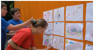
Joniškio miesto šventės metu savanoriai dailio skrajutes, padėjo organizuoti konkursus

besilankančių bibliotekoje neskaičiuoja, bet tvirtina, jog jų yra ne viena dešimtis.