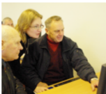
Geriausius kompiuterinio raštingumo mokančius bibliotekininkus rinks gyventojai

Siekiant paskatinti šalies bibliotekininkus ir įvertinti jų darbą, mokant gyventojus naudotis kompiuteriu ir internetu, rudenį organizuojami geriausių kompiuterinio raštingumo gyventojus mokančių bibliotekininkų rinkimai. Nuo spalio pradžios dvi savaites bibliotekų lankytojai galės siūlyti bibliotekininkus apdovanojimams pildydami elektroninę rinkimų formą patalpintą bibliotekų kompiuteriuose. Nominacijų laimėtojus išrinks speciali projekto „Bibliotekos pažangai“ vertinimo komisija. Rinkimuose nominuoti bibliotekininkai metų pabaigoje bus pakviesti dalyvauti šventiniame renginyje, kurio metu bus paskelbti nugalėtojai ir apdovanoti vertingais remėjų prizais.