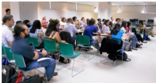
IFLA kongresas: bibliotekos negali ignoruoti pokyčių visuomenėje

tema – jaunųjų bibliotekininkystės specialistų įtraukimas į profesinį pasaulį, mokslinę veiklą ir šių specialistų generuojamų idėjų panaudojimas bibliotekų veikloje. IFLA organizacijoje jaunųjų bibliotekininkų iniciatyva neseniai susibūrė „Naujų profesionalų poreikių grupė“, kuri vienija profesinę karjerą pradėnančius bibliotekininkus. Moderniais metodais bendraudami šioje grupėje, jie ne tik dalijasi tarptautine patirtimi, bet ir gali lengviau įveikti profesinius iššūkius.